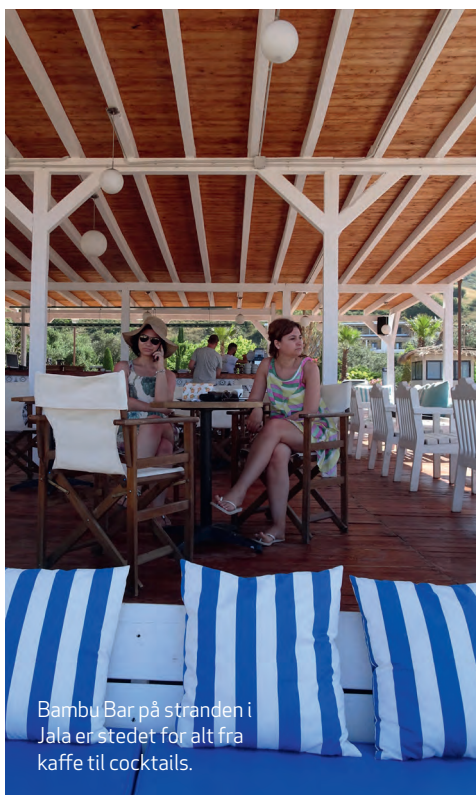
Bambu Bar på stranden i Jala er stedet for alt fra kaffe til cocktails.

Apollo har charterrejser til Dhermi og Himare , apollorejser.dk . Alternativet er fly fra København til hovedstaden Tirana , men kun med mellemlanding, f.eks. med Austrian Airlines, austrian.com . Fra Tirana 202 kilometer ad motorvej/bjergvej i lejet bil.