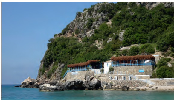
Ostria Restaurant serverer hjemmelavet græsk mad med topfriske råvarer.